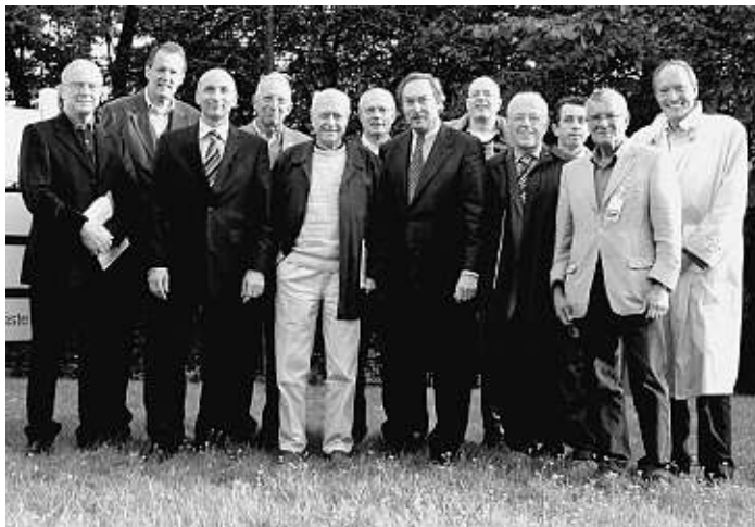
Die Ausflugsgruppe der Hechte mit ihren Gastgebern.

Unser Interesse galt neben den allgemeinen Informationen vor allem aber der Mohn media arvato AG, einem internationalen Medien- und Kommunikationsdienstleister. Die Schwerpunkte sind Agenturleistungen, Datenmanagement und -Aufbereitung, arvato print mit Druckverfahren von Offset- bis Digitaldruck mit insgesamt 35 Druckmaschinen, Druckweiterverarbeitungen, Logistik und Servicecenter.